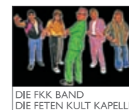
DIE FKK BAND DIE FETEN KULT KAPELLE