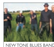
NEW TONE BLUES BAND