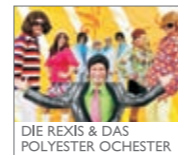
DIE REXIS & DAS POLYESTER OCHESTER