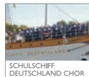
SCHULSCHIFF DEUTSCHLAND CHOR