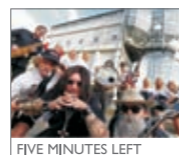
FIVE MINUTES LEFT