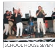
SCHOOL HOUSE SEVEN